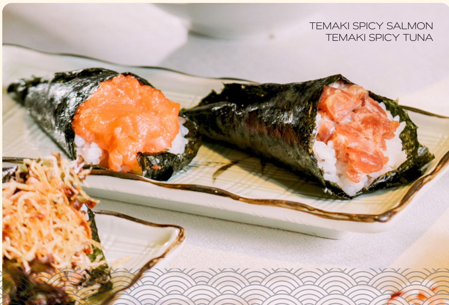
TEMAKI SPICY SALMON TEMAKI SPICY TUNA