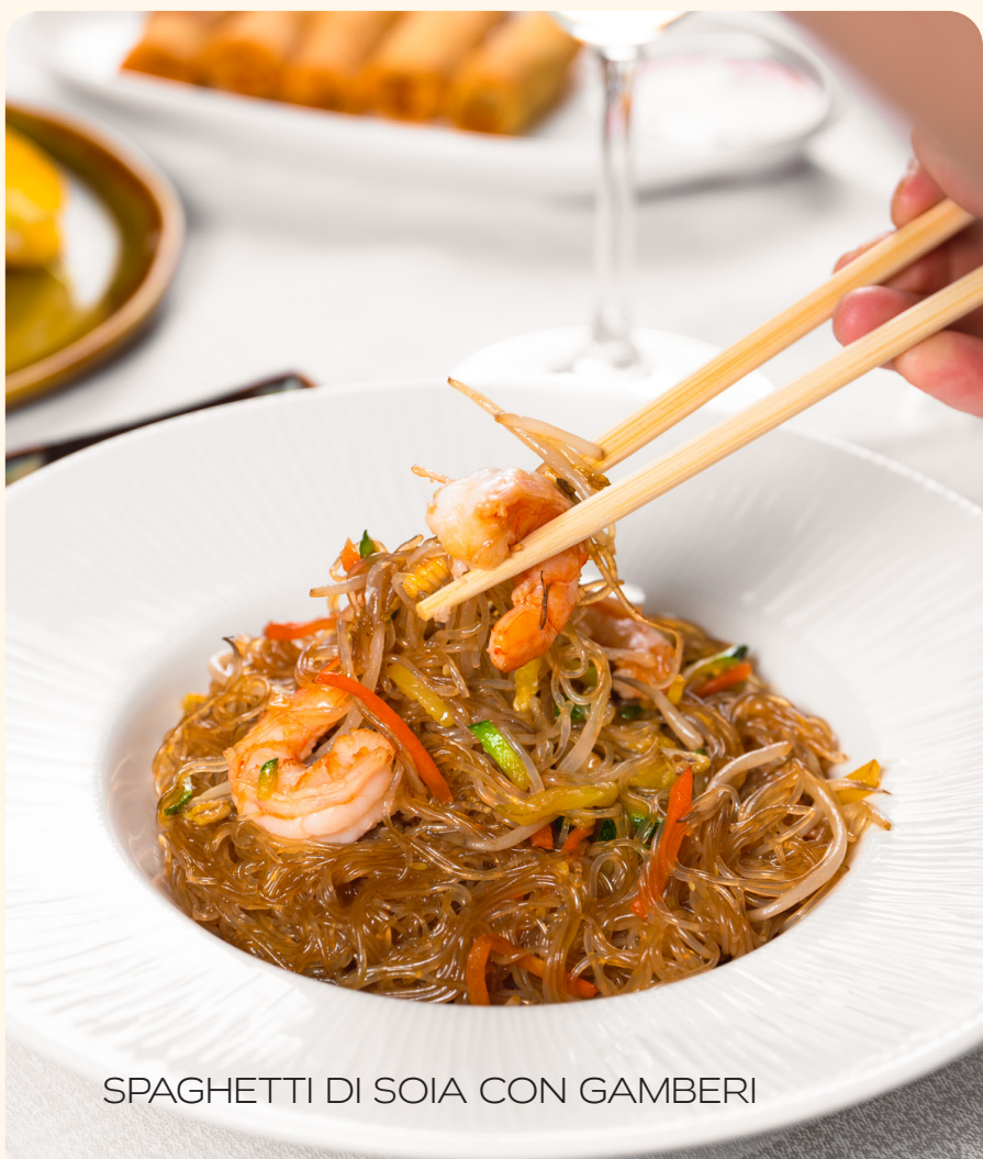
SPAGHETTI DI SOIA CON GAMBERI