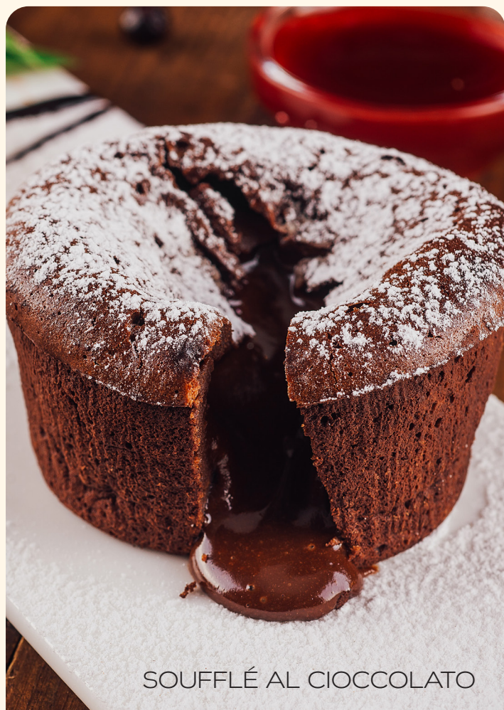
SOUFFLÉ AL CIOCCOLATO