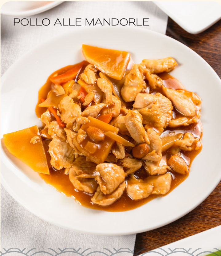
POLLO ALLE MANDORLE